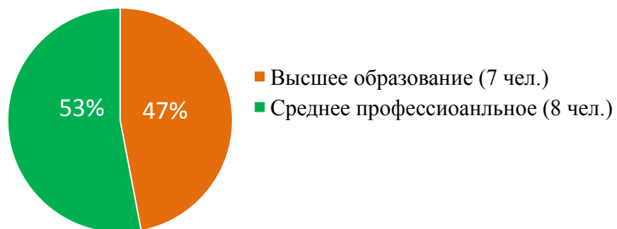
Характеристика педагогов по уровню образования